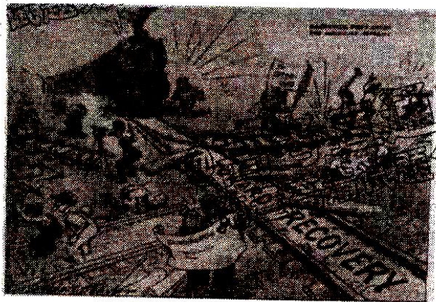
图3 《主线路在哪里?》(1934年)