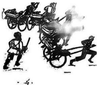
图1 《印度巡捕驱散黄包车》木刻版画

8.20世纪三、四十年代，避难上海的德国犹太画家白绿黑以质朴的木刻版画形式，创作了大量体现社会底层黄包车夫的作品（如图1）。这反映了