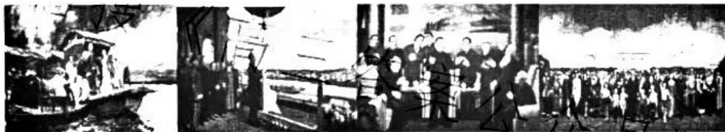
启航——中共一大会议

2.以小故事讲述大历史,以小细节呈现大时代。穿越时空,经典美术作品定格了中国共产党百年来重大事件与历史瞬间,勾勒出百年奋斗历程。对以下画作所反映的史实意义