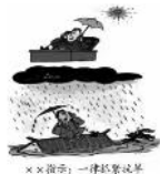
思想政治试题 第3页(共8页)