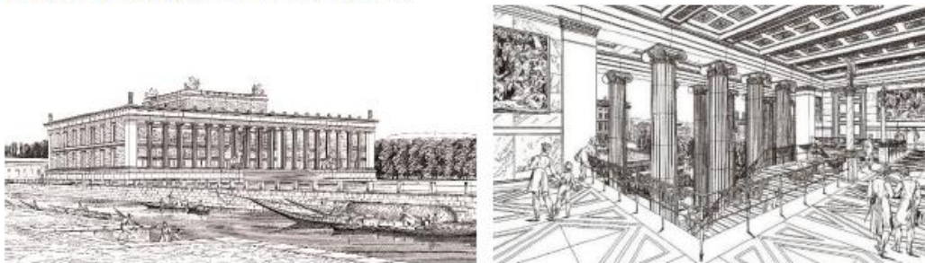
申克尔设计的博物馆及其二楼大厅透视图

18世纪末的欧洲，博物馆向大众开放的呼声日益高涨。1822年，普鲁士国王威廉三世将建设博物馆的大任交到申克尔的肩上。