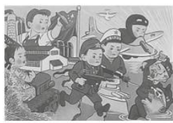
图1 新中国的儿童 1950年