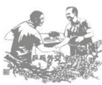
图2 乒乓外交 1971年