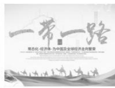
图4 “一带一路” 2013年

围绕“宣传画里的历史”,提取以上一幅或多幅图片信息,自拟论题,展开论述。(要求:主题明确,史论结合,表述清晰。)