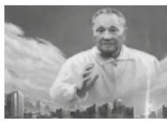
图3 邓小平同志南巡 深圳 1992年