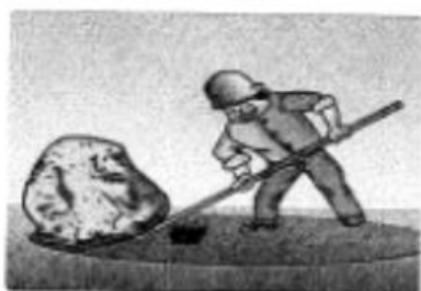
《有时候的成功,角度比力度更重要》