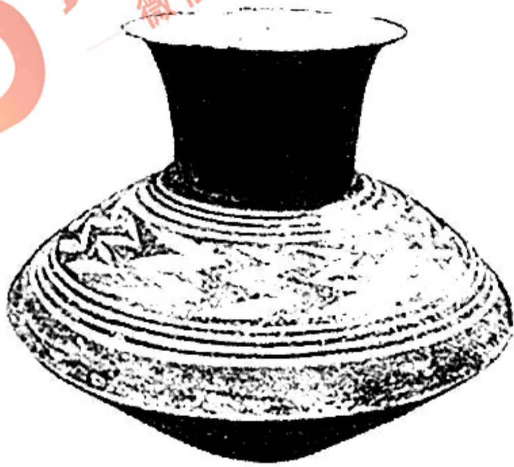
图 2 公元前 4 千纪西亚彩陶罐