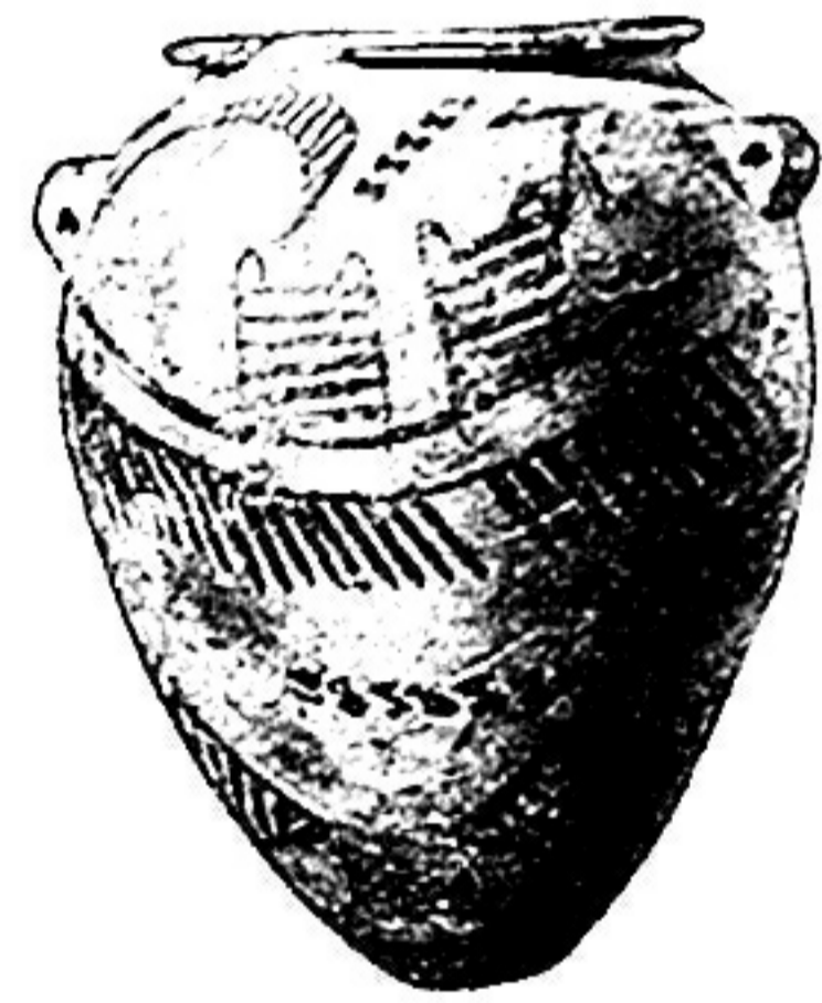
图 3 埃及前王朝时期(公元前 4 千纪)红陶花瓶