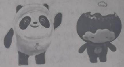
北京2022年冬奥会和冬残奥会吉祥物