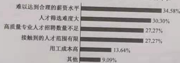
2020年疫情给公司招聘人才环节带来的主要困难

材料二 2020年10月15日,中共中央政治局常委、国务院总理李克强在北京人民大会堂出席2020年全国大众创业万众创新活动周,发表重要讲话,并宣布活动周正式启动。