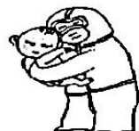
比病毒蔓延更快的 爱和希望