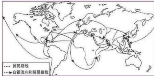
图 5 公元 1400—1800 年世界主要贸易路线和白银流向示意图