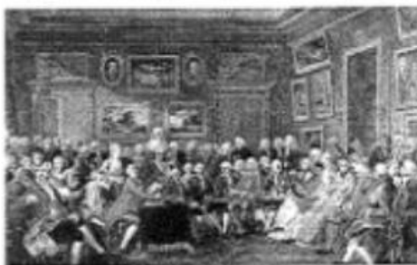
图3 勒莫托埃《在若弗兰夫人沙龙里诵读伏尔泰的悲剧〈中国孤儿〉》

18世纪的欧洲被冠以各种名称:“理性时代”“启蒙时代”“批判时代”“哲学世纪”“人文主义时代”等。不同的称呼反映了人们对18世纪欧洲历史的不同理解。围绕18世纪的欧洲历史,选择某一称呼或者自拟一个称呼,并运用所学世界史的具体史实,予以论述。(要求:以称呼为题,论证充分,史实准确,表述清晰。)