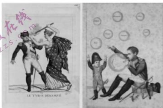
版画一《去掉面具的暴君》 版画二《随风而逝》

如何看待拿破仑是法国历史始终绕不过去的一个话题。他的形象一直随着时代的变化而变化,派别不同,给出的解释也不同。这两幅版画创作于1814年,版画一中拿破仑被动物化成一头野心勃勃的