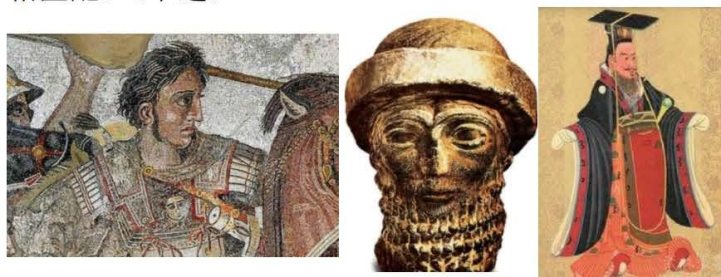
A. 马其顿国王亚历山大 B. 古巴比伦国王汉谟拉比 C. 汉武帝刘彻

(1)古代的君主们曾在世界各地建立了不同的国家，请将下列君主与其国家的发源地相匹配。(单选)