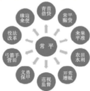
常平业务范围示意图