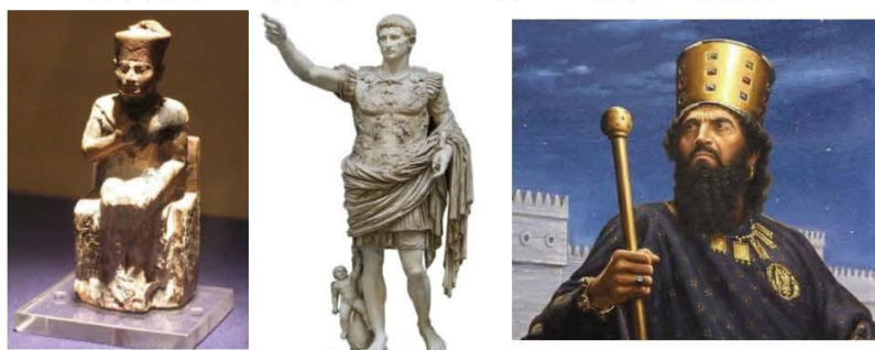
D. 埃及法老胡夫 E. 罗马帝国元首屋大维 F. 波斯国王大流士一世