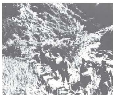
▲刘邓大军千里跃进大别山