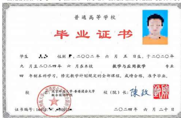
北京师范大学-香港浸会大学联合国际学院 本科毕业证书（教育部电子注册）