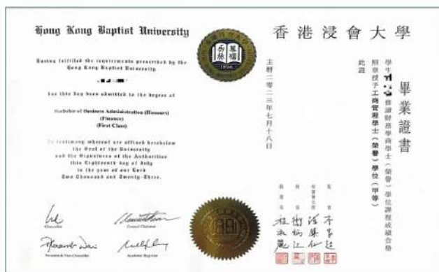
香港浸会大学学士学位证书（内地、香港及国际范围均获认可）